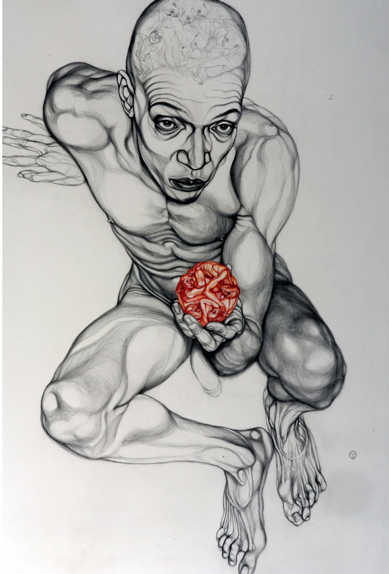
A Waiting for the Sun – 2007 (Venter på sola). Kull og fargeblyant på papir. – 142 x 102 cm.