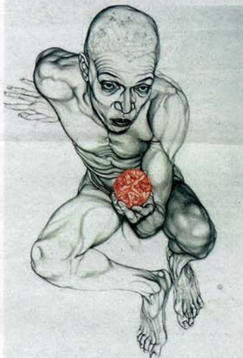
Waiting for the sun, 2007. (Graft + färgblyerts på papper)