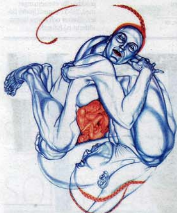
Whirligig, 2007. (Färgblyerts på papper)