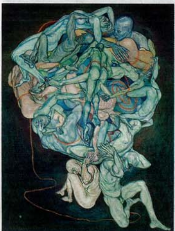
Stitched with its colour, 2008. (Olja och pierre noir på duk)