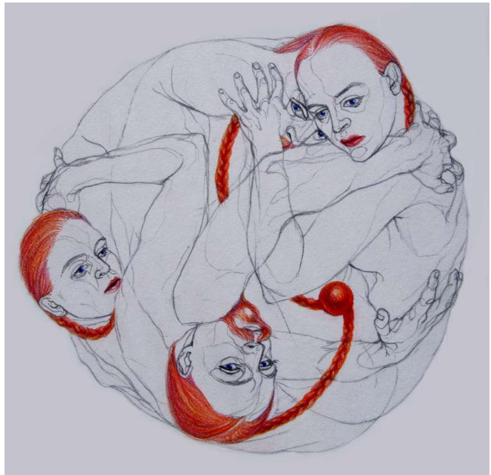
Triskelion , 2008. (Wall Drawing, Charcoal and Pastels)

That Kjøk belongs to the Poussiniste camp of art seems a given, and this to such an extent that not only is color inferior to line here (such as in colored drawings), but its exclusive function seems to be to accentuate the line – this line that in Kjøk’s art so